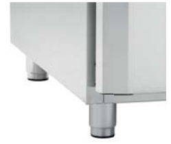
BEIN, KORTE 70/105 MM