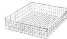
TRÅDKURV AV RUSTFRITT STÅL