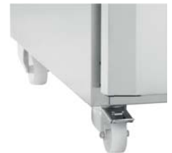
TRINSER SOM ERSTATTET BEIN