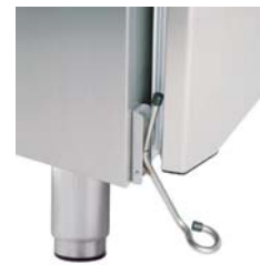
FOTPEDAL TIL DØRÅPNER