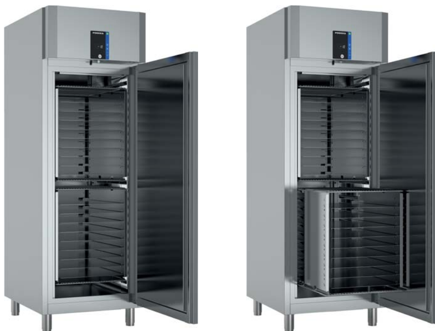
Inventus SKS 7

Bare materiale og komponenter av høyeste kvalitet benyttes i konstruksjonen, inkludert rustfritt stål av AISI 304-kvalitet innvendig og utvendig. Det er mulig å bestille ulike modeller som kan ta bakeriplater på 400 x 600mm, 450 x 600mm eller 600 x 400/450mm (bakeriplater følger ikke med).