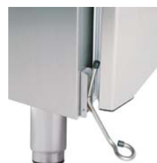
FOTPEDAL TIL DØRÅPNER