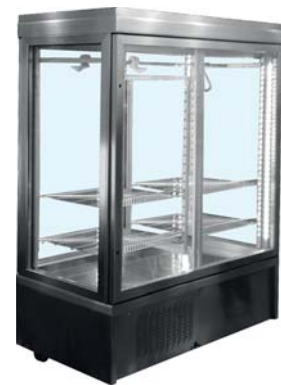
CAR 2 (bakre)