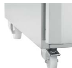
TRINSE SOM ERSTATTET BEIN