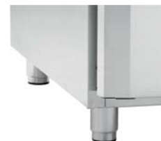
BEIN, KORTE 70/105 MM