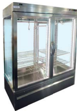
CAR 2 (foran)