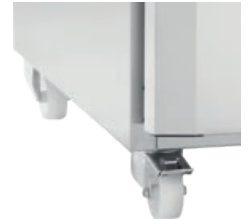
TRINSER SOM ERSTATTET BEIN