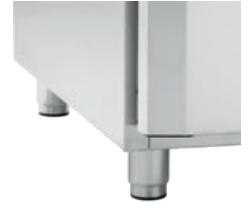
BEIN, KORTE 70/105 MM STÅL