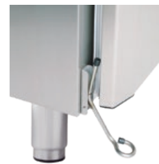
FOTPEDAL TIL DØRÅPNER