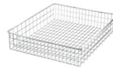
TRÅDKURV AV RUSTFRITT STÅL